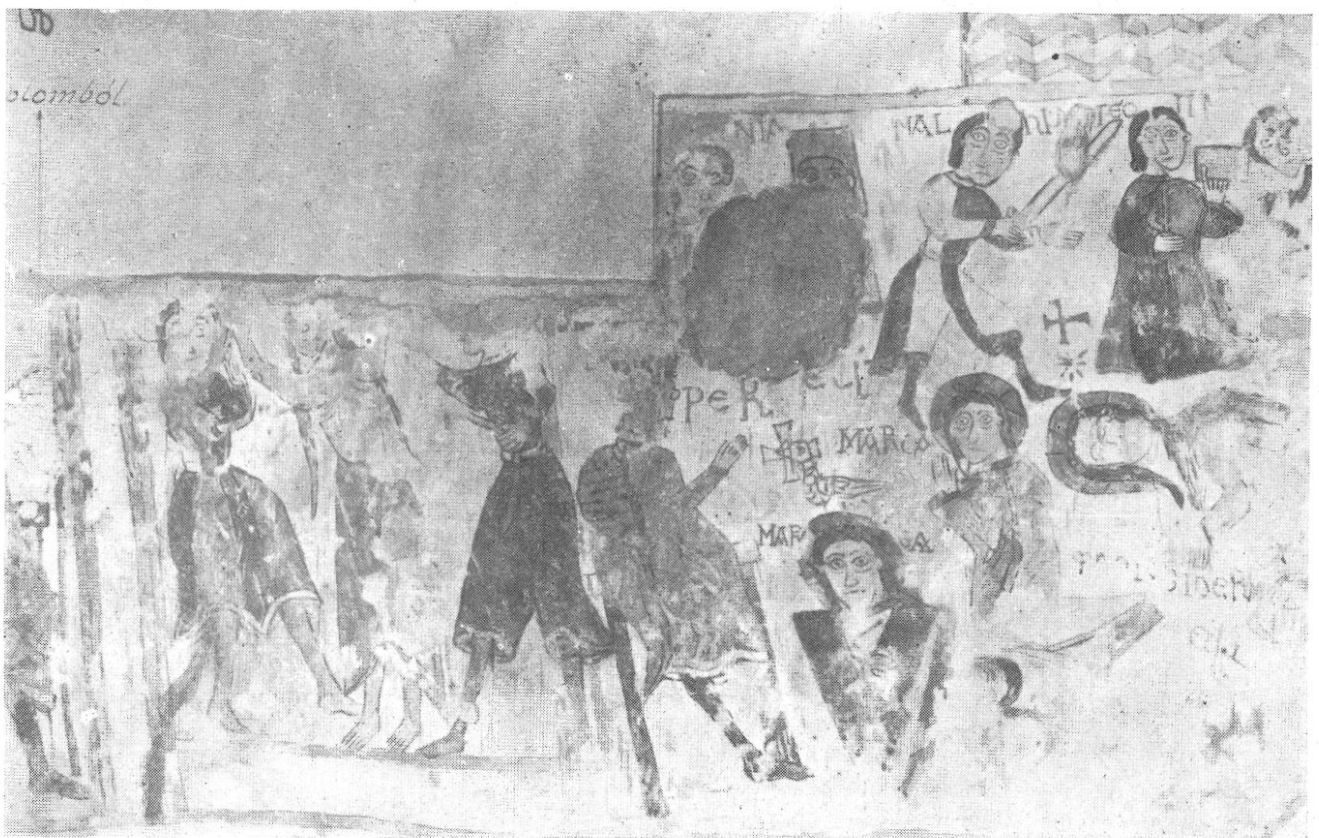
A szalonnai falfestmény jobbkez felől eső része