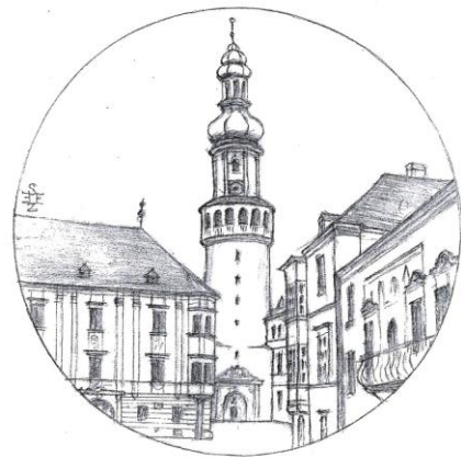
Sz. Egged Emma

parancsot eszközölt ki a protestánsok jogainak a korlátozására, nem rettent vissza a soproni városvezetők bécsi beidézésétől, illetve elfogatásától sem. 1584 áprilisában Ernő főherceg idézésére a Bécsben megjelenő Johann Stainer polgármestert, Johann Gering városbíró, a belső és a külső tanács több tagját kilenc héten át egy szobában elzárták. A nyomásnak eleget téve, végül a város kénytelen volt lelkészeitől, evangélikus tanítóitól búcsút mondani, s azokat a városból, illetve jobbágyfalvaiból eltávolítani.