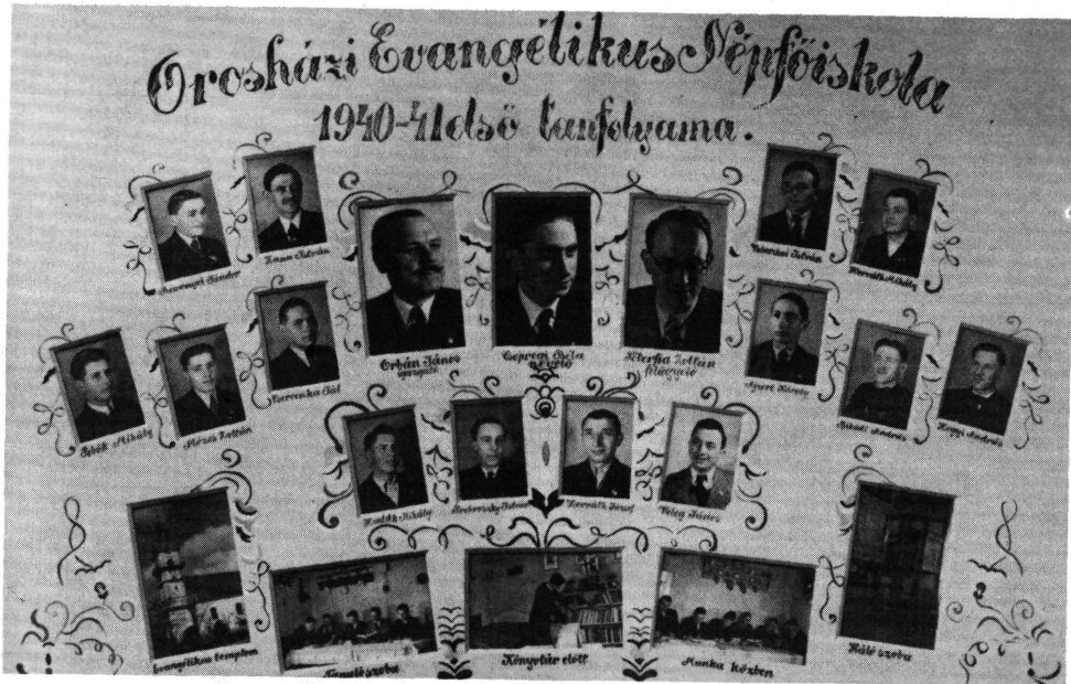
A népfőiskolások első végzett évfolyama és tanárai